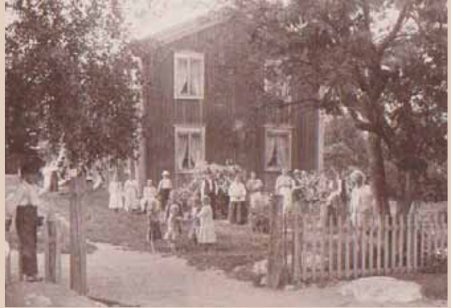
VAS.: Kevari ja osa sen omenatarhaa 1930-luvulla. Kuva on otettu navetan katolta.