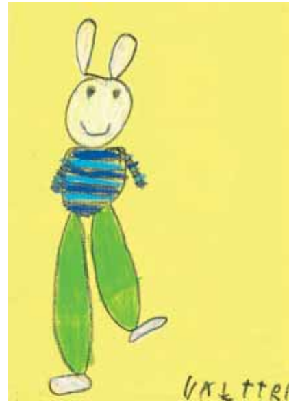
Valtteri Katajala 1. lk