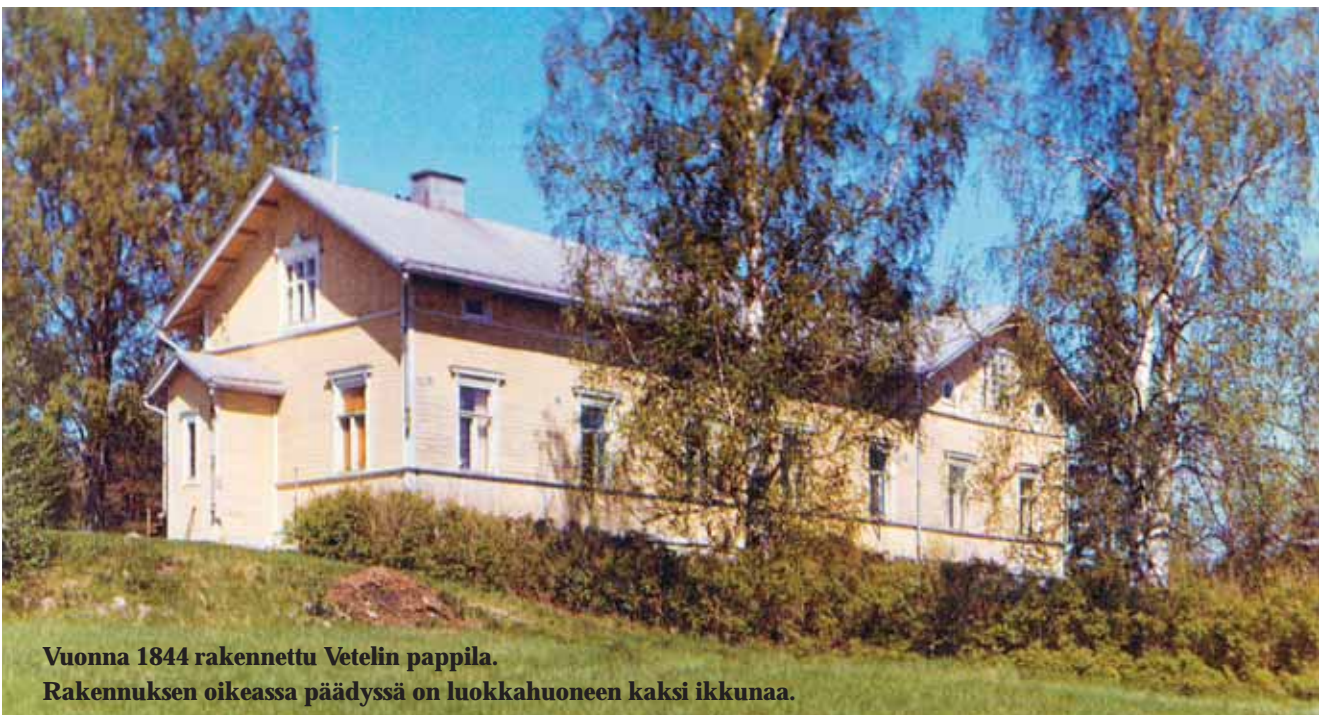
Vuonna 1844 rakennettu Vetelin pappila. Rakennuksen oikeassa päädyssä on luokkahuoneen kaksi ikkunaa.