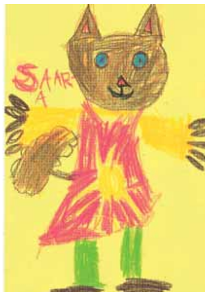
Saara Huusko 1. lk