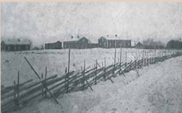
ALAKUVAT: Vanhantalonkangas 1910- ja 1930-luvulla kuvattuna ent. Jyväskylän tieltä nykyisen Jukkalan paikkeilta.