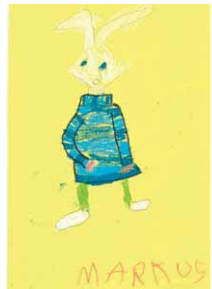
Markus Torppa 1. lk