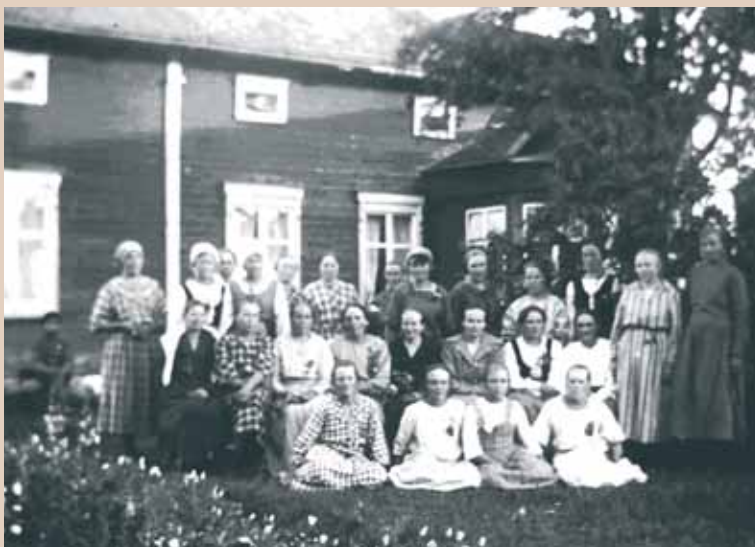
VAS. YLH.: Veteliläistä naisväkeä kokoontuneena Alfreen talon seinustalle 1930-luvulla.