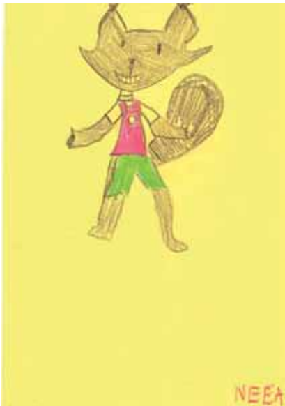
Neea Hautala 1. lk