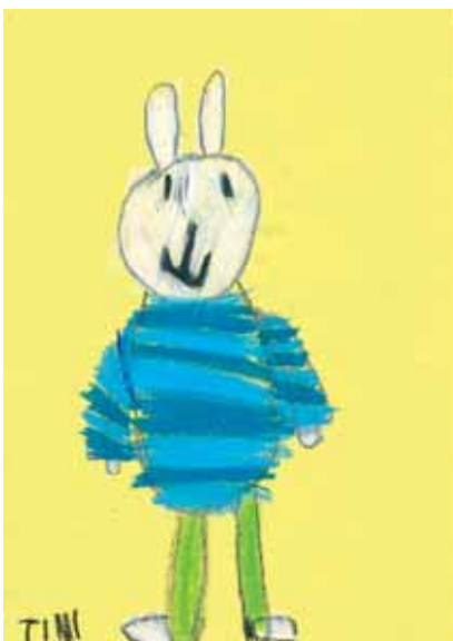
Timi Rannila 1. lk