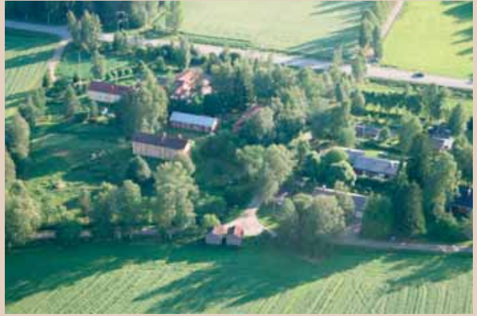
Tunkkarin Vanhantalonkangas ilmasta 30.8.2009. Keltaiset Vanhatalo ja nykyinen Lempiälän talo vasemmalla.